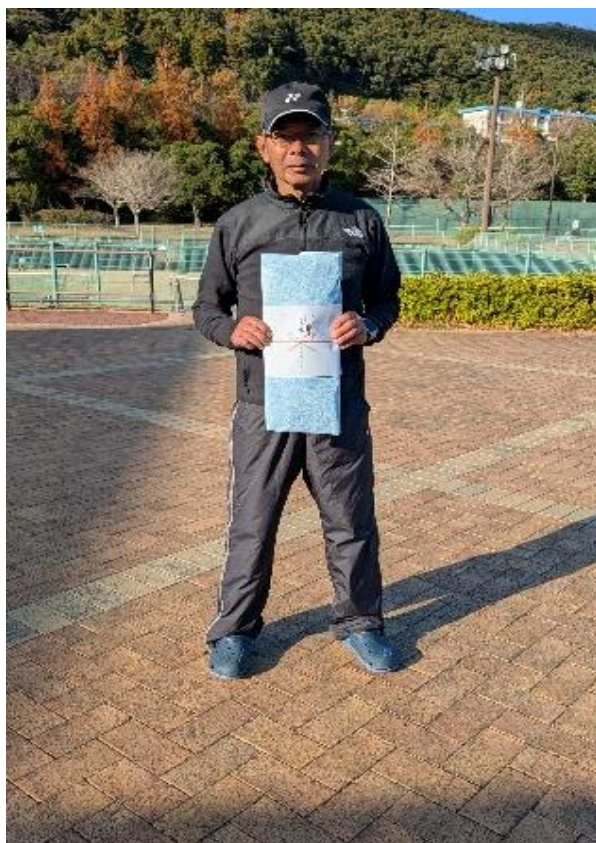
シングルス男子 60 優勝