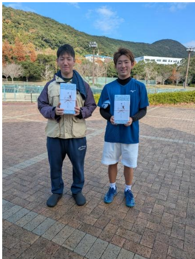
シングルス男子 A・B 各 3 位