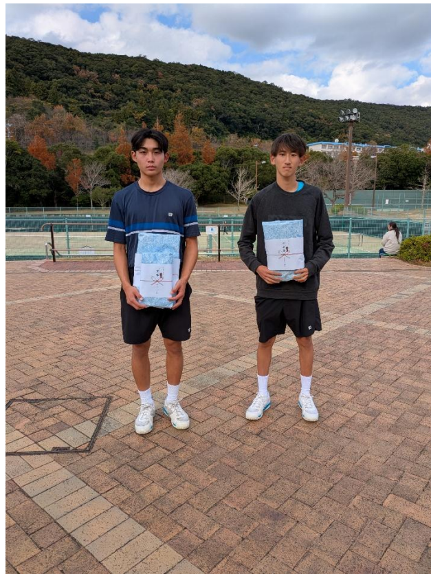
シングルス一般男子 B 優勝 準優勝