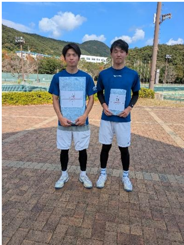
シングルス一般男子 A 優勝 準優勝