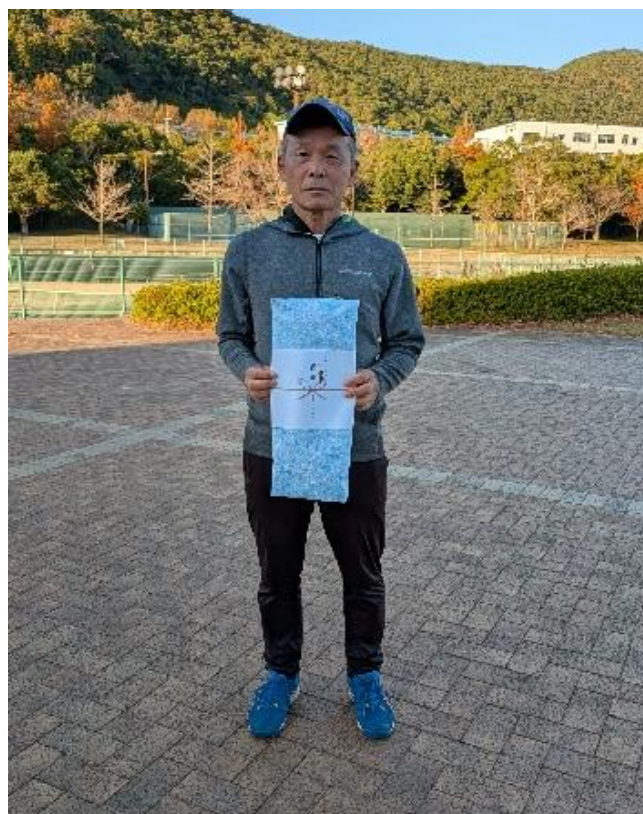
シングルス男子 55 優勝