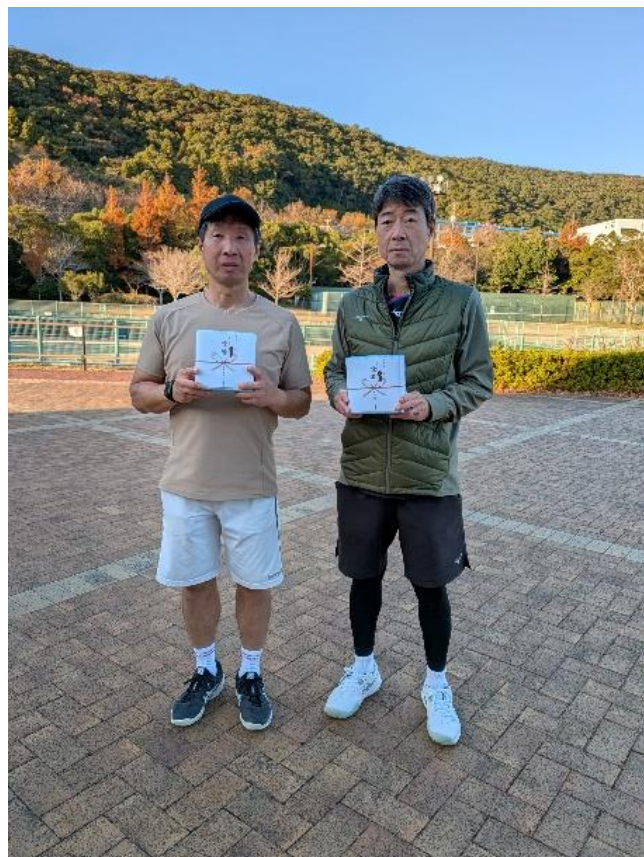
ダブルス男子 55 優勝