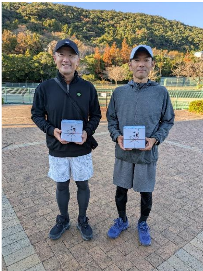
ダブルス男子 45 優勝