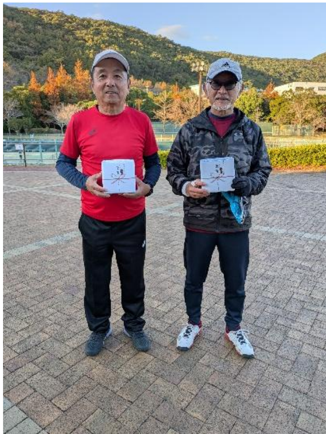
ダブルス男子 65 優勝