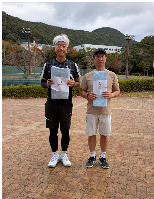
シングルス男子 45 優勝 準優勝