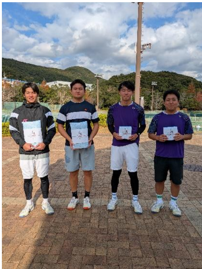
ダブルス一般男子 A 優勝・準優勝