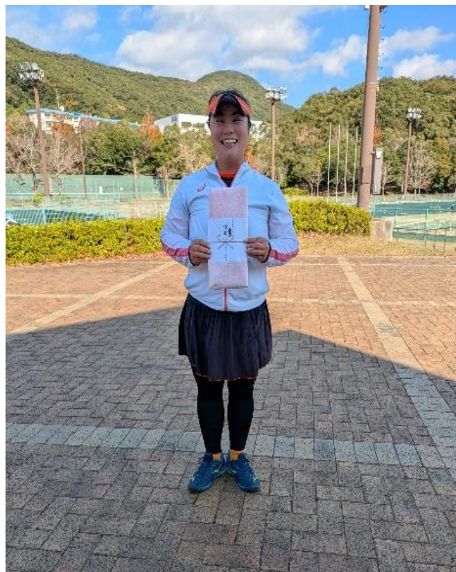
シングルス女子 40 優勝